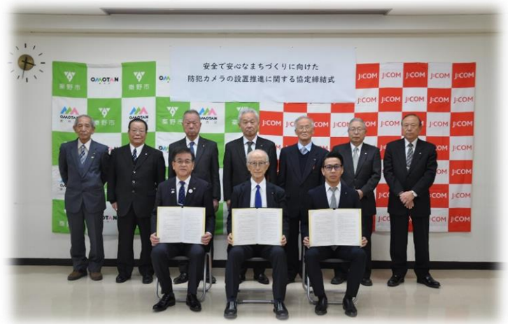
令和7年2月3日 締結式の様子

昨今、全国的に発生している闇バイト関連などの事件を受け、地域のみなさんの防犯カメラに対する関心が高まっています。そのため、秦野市防犯協会では、秦野市自治会連合会、株式会社ジェイコム湘南・神奈川西湘局（以下「J:COM」という）と「安全で安心なまちづくりに向けた防犯カメラ設置推進に関する協定」を令和7年2月3日に締結しました。