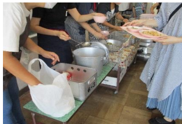
手際の良い配膳でした。