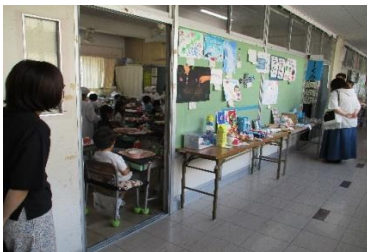
廊下から配膳の様子を見学しました。