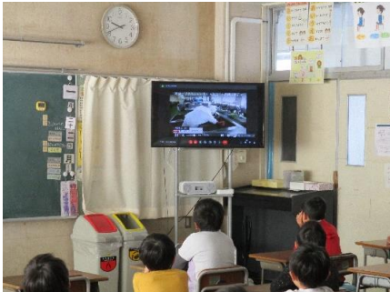
「給食ができるまで」視聴