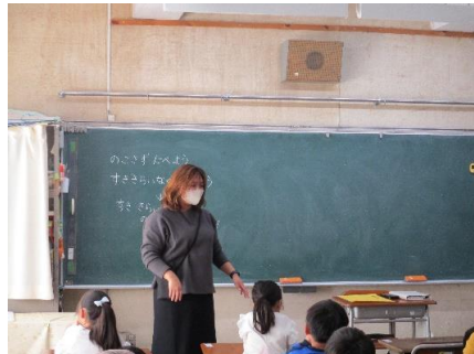
給食週間中のクラスのめあてを決めました。