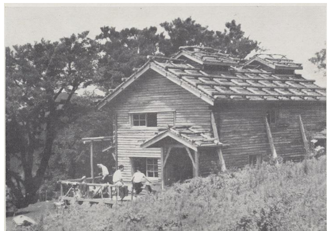
とうのたけ そんぶつ 「塔ノ岳の尊仏小屋」