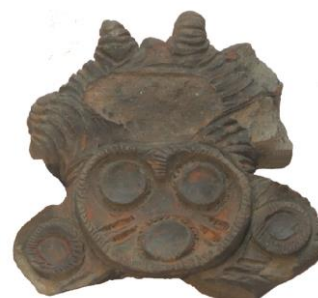
ミズク土偶 たいがくいん 「太岳院遺跡出土」