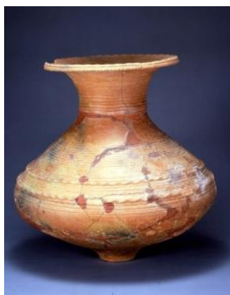
神奈川県指定重要文化財 弥生時代前期壺形土器 ひらさわどうめい (平沢同明遺跡出土)

市内遺跡から出土した後期旧石器時代(1万6000年以上前)から縄文・弥生・古墳時代を経て中世までの土器や土偶、石器、陶磁器などの遺物50点をはじめ、遺跡の写真や古代市域の記述が残る「続日本記」 わみょうるいじゆしやう 「和名類聚抄」の解説、明治時代の軽便鉄道レールなどを展示しています。