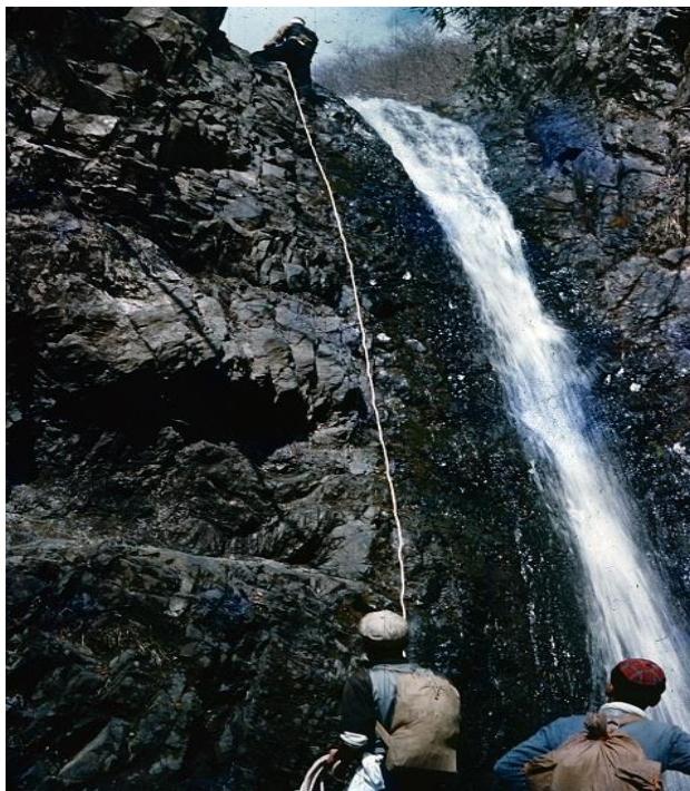
かんしちさわ 「勘七沢の沢登り」1958 年

期 間 平成 28 年 7 月 21 日(木)から 8 月 28 日(日) 午前 9 時から午後 5 時まで (入館は午後 4 時 30 分まで) 場 所 桜土手古墳展示館 映像室 入 場 料 無料