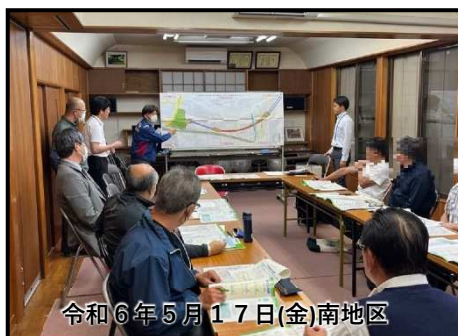
令和6年5月17日(金)南地区