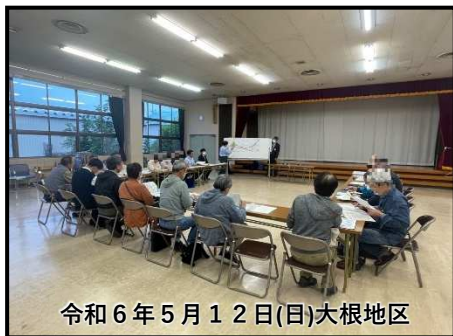
令和6年5月12日(日)大根地区