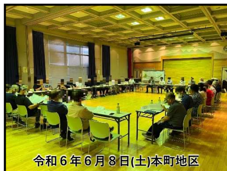
令和6年6月8日(土)本町地区