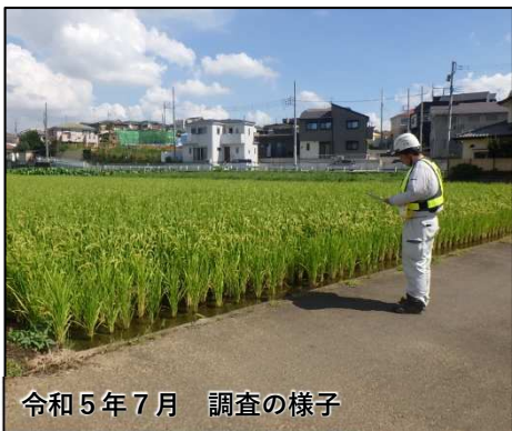
令和5年7月 調査の様子

田畑を潤すために必要なかんがい用水について、本年7～8月に水路系統の詳細確認、あわせて河川や湧水箇所などを確認するための現地踏査を実施しました。