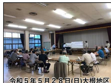
令和5年5月28日(日)大根地区