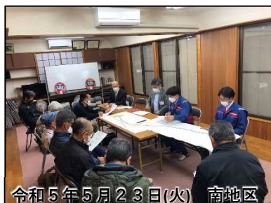
令和5年5月23日(火)南地区