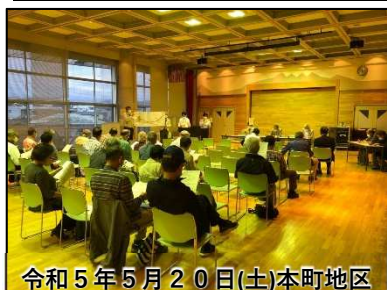
令和5年5月20日(土)本町地区